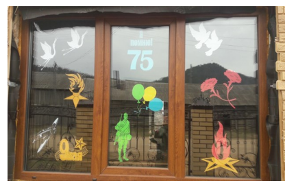
Роман Сobotюк, 5 «Б» класс