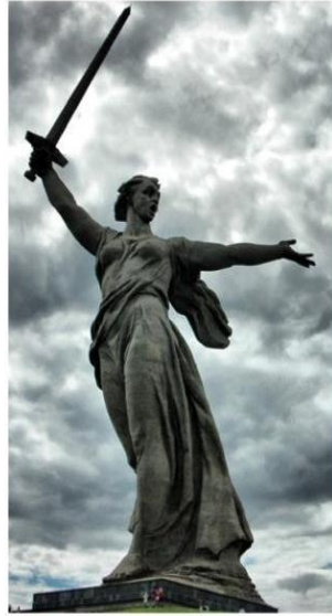
«Родина-мать зовёт!» — композиционный центр памятника-ансамбля «Героям Сталинградской битвы» на Мамаевом кургане в Волгограде. Одна из самых высоких статуй мира.

В войсках отлично понимали политическое и моральное значение этого сражения. 5 октября 1942 г. был отдан приказ Сталина: «Город не должен быть сдан противнику». Лозунгом обороняющихся стали слова снайпера Василия Зайцева: «За Волгой для нас земли нет».