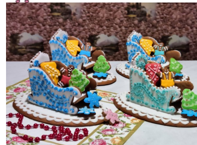
Автор: Терентьева Наталья Валерьевна – учитель начальных классов. МОУ «Золотоключевская НОШ»