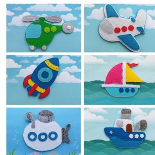
Автор: Рыбина Анна Яковлевна – заведующая

МДОУ «Турунтаевский ЦРР-детский сад» (транспорт из фетра)