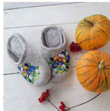
Автор: Челмакина Светлана Викторовна – учитель начальных классов. МОУ «Ильинская санаторская ООШ»